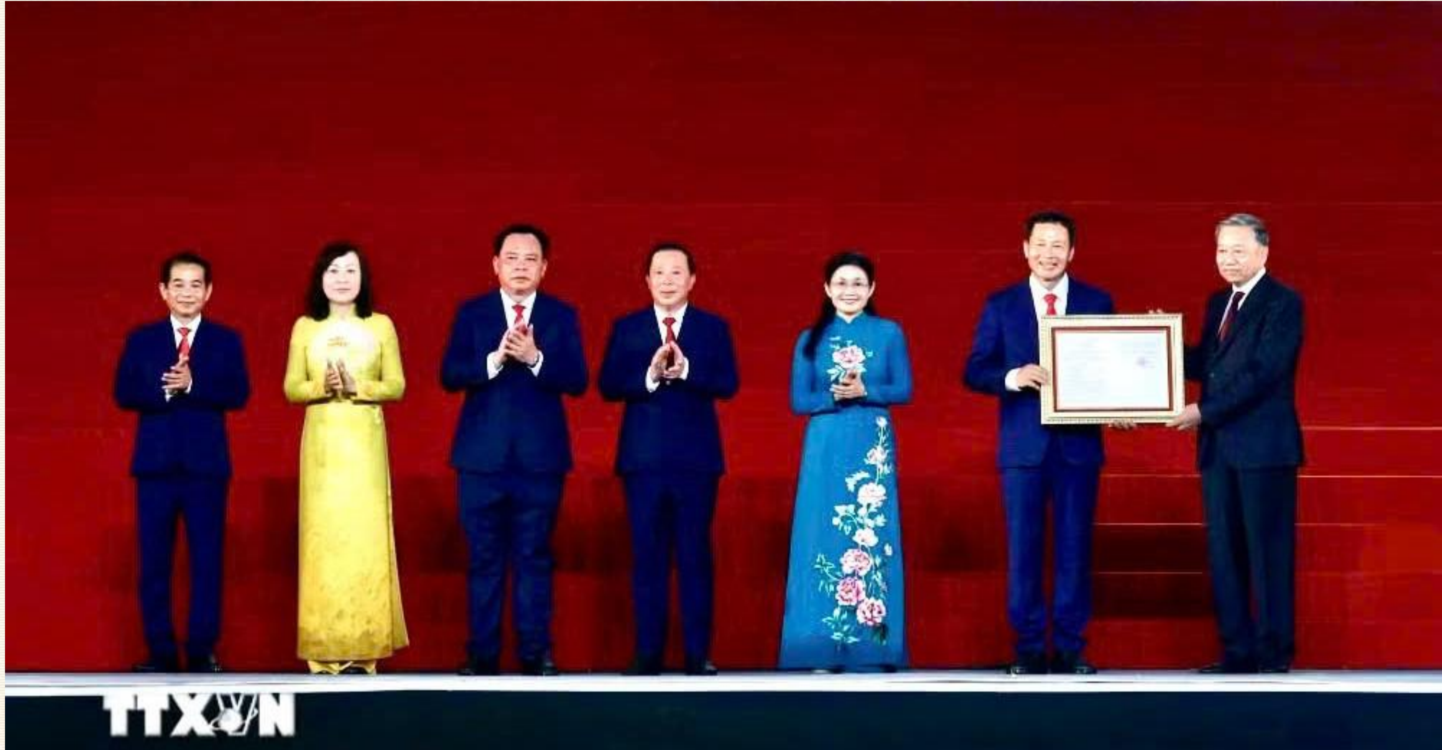
Hình ảnh: đồng chí Tổng Bí thư, Chủ tịch nước Tô Lâm trao Nghị quyết thành lập Thành phố Đồng Nai cho lãnh đạo thành phố tại Lễ công bố ngày 18/5/2026