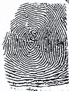
Ngón trỏ trái Left index finger